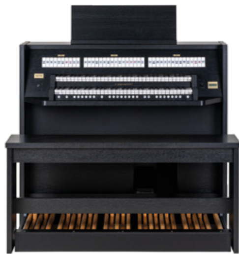
De Opus 260 De Opus 260 zet altijd de juiste toon

De Opus 260 beschikt over een stijlvariabele dispositie van 36 stemmen. Deze stemmen, verdeeld over vier orgelstijlen, zijn allemaal afkomstig van de pijporgels uit de kerken van Kampen, Amsterdam, Raalte, Parijs en Dresden. Wanneer de organist plaatsneemt achter de Opus 260, schakelt hij moeiteloos over van de ene samplebank en naar de andere. En of er nu muziek van Bach op de lessenaar staat, of van Guilman, de Opus 260 zet altijd de juiste toon.