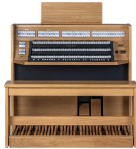
De Opus 360 Een meesterlijk orgel voor iedere organist

De Opus 260 beschikt over een stijlvariabele dispositie van 36 stemmen. Deze stemmen, verdeeld over vier orgelstijlen, zijn allemaal afkomstig van de pijporgels uit de kerken van Kampen, Amsterdam, Raalte, Parijs en Dresden. Wanneer de organist plaatsneemt achter de Opus 260, schakelt hij moeiteloos over van de ene samplebank en naar de andere. En of er nu muziek van Bach op de lessenaar staat, of van Guilman, de Opus 260 zet altijd de juiste toon.